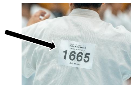
ユース男子・一般女子・一般男子の部門